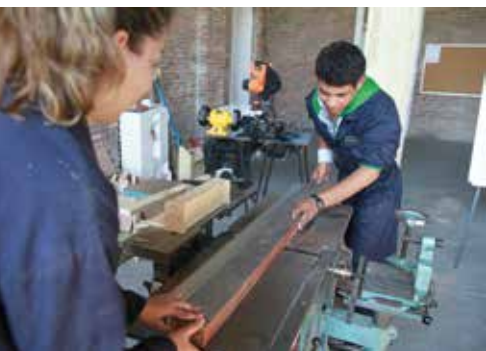
Jóvenes en Escuela Taller de Artes y Oficios Patrimoniales

Creación del Centro de Innovación en Tecnología de Alimentos de Colonia. La Casa del Emprendedor. Proyecto Los Océanos Dividen la Juventud Une.